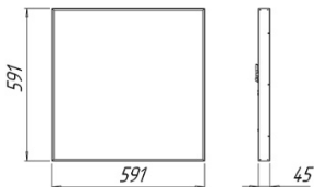
Рисунок 1 Светильник «L-office 32 Premium/Em»

1.7 Общий вид и габаритные размеры светильника показаны на рисунке 1.